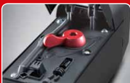
bezpečný a komfortní systém nouzového odblokování, bez jakéhokoliv nářadí