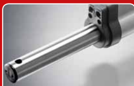
elektronické koncové spínače s infračervenými senzory zajišťují precizní vypnutí v koncové poloze

04/2013 – tiskové chyby a změny vyhrazeny.